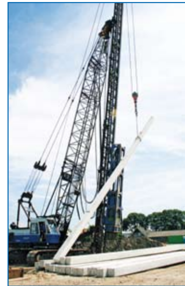
Het ophangen van een heipaal Heimachine aan het heien in een kraan

Heipalen hebben in verband met corrosie van de wapening het grote voordeel dat zij zich bijna permanent onder water bevinden. Transport van schadelijke stoffen, wat veelal gepaard gaat met vochtbewegingen, is hierdoor uitzonderlijk moeilijk. Daarnaast is voor de corrosie van de wapening zuurstof benodigd en dit is onder water gewoonweg niet beschikbaar. Dit alles komt tot uitdrukking in het feit dat voor heipalen gewoonlijk milieuklasse XC2 kan worden gehanteerd. Mocht echter een gedeelte van de heipaal herhaaldelijk droog vallen, waardoor toch gemakkelijk zuurstof kan toetreden, dan is het zaak milieuklasse XC4 te specificeren in plaats van XC2.