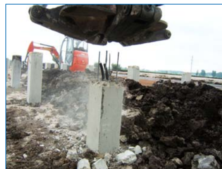
Paal zoals geheid en voorzien van warmtecirculatiepakket

Met behulp van een warmtepomp wordt in de winter warmte aan de circulatievloeistof onttrokken en op een hogere temperatuur gebracht, zodat die geschikt is om een gebouw te verwarmen. Het onttrekken van warmte uit de bodem betekent op zijn beurt weer dat er afkoeling van de bodem plaatsvindt. Er ontstaat dan een koudepotentieel wat in de zomerperiode voor koeling kan zorgen. De positieve eigenschappen van de twee tegenovergestelde seizoenen vullen elkaar op die manier uitstekend aan en overschotten worden toch volledig benut.