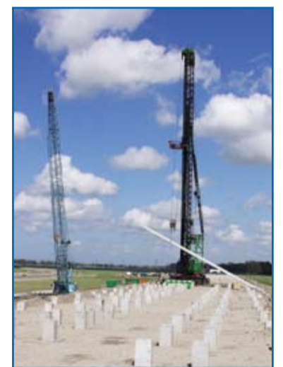
Palen worden perfect op hoogte geheid.

Kortom, de stekverbinding is allang niet meer de enige manier om een goede samenwerking te bewerkstelligen tussen de fundering en de prefab betonnen heipaal. Koppensnellen is in veel gevallen niet nodig en is daarom zonde van tijd, materiaal en geld.